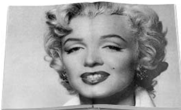
Marilyn mit LIBRETTO®

Nach vollem Engagement: Der Druck ist perfekt, die Gestaltung genial, der Bild-einsatz vom Feinsten, das Papier edel wie nie. Und nun dies: Das Werk klappt ständig zu, man benötigt beide Hände zum Lesen und die Bilder über den Bund wirken verzerrt. Wen würde das nicht ärgern?